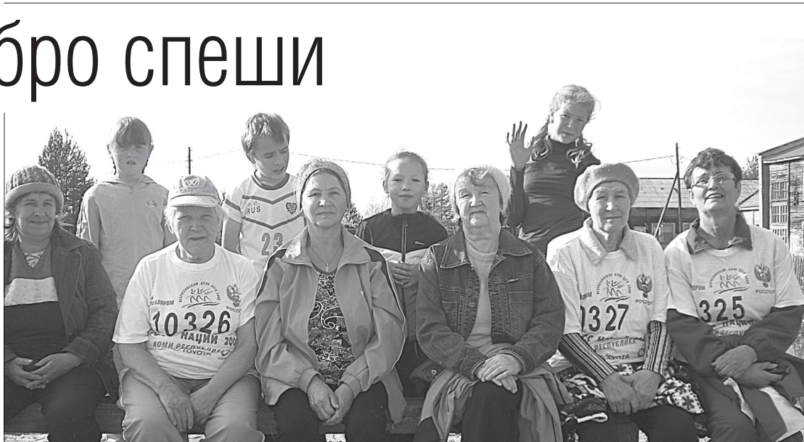
Ветераны и школьники.

На кружке «Рукодельница» сделали цветы из бумаги для украшения сцены в клубе ко Дню пожилых людей, связали сувениры и подарки бабушкам, дедушкам, а также своим учителям.