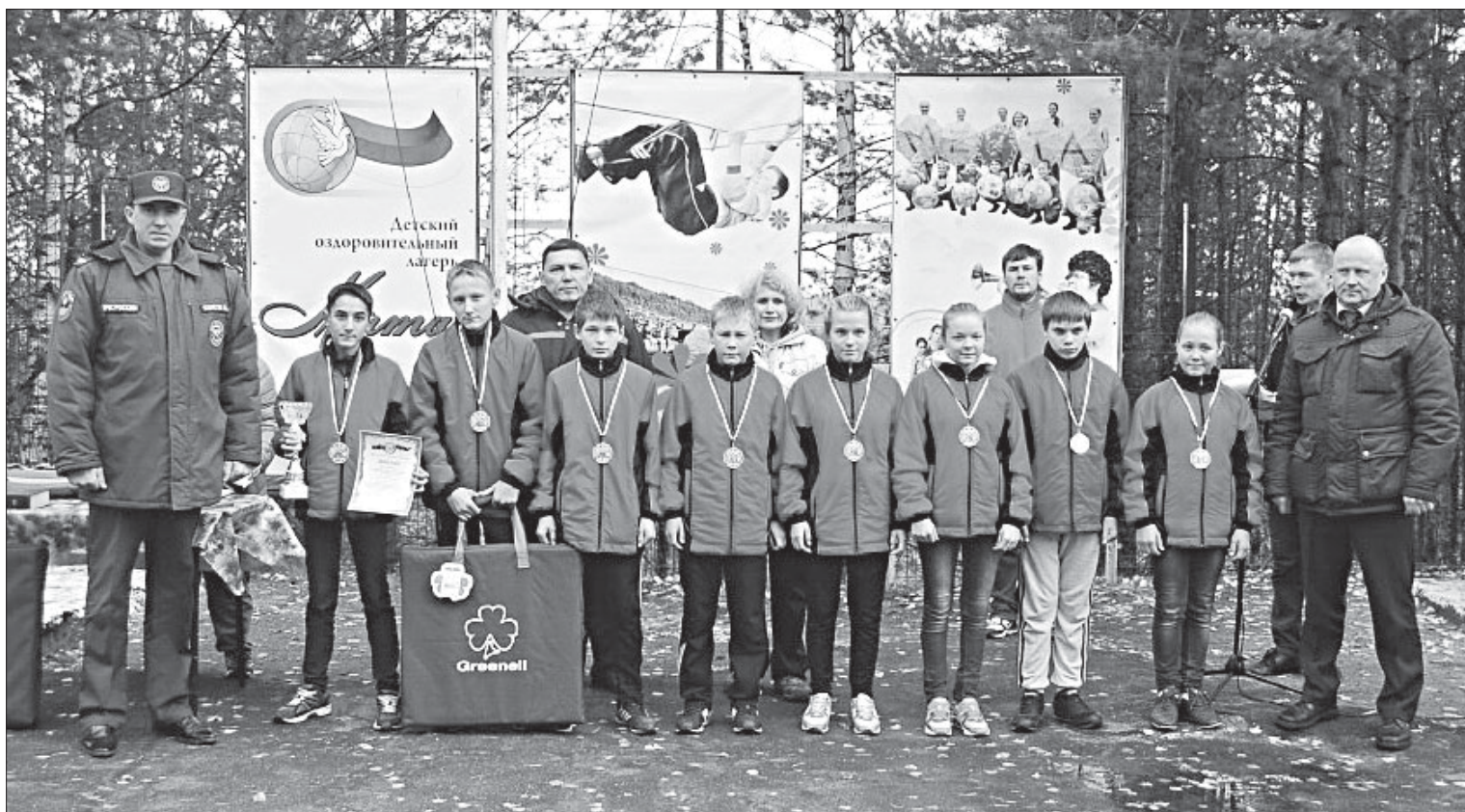
Участники соревнований «Школа безопасности».

Во второй день прошли соревнования «Пожарная эстафета», где группе из пяти человек необходимо было преодолеть