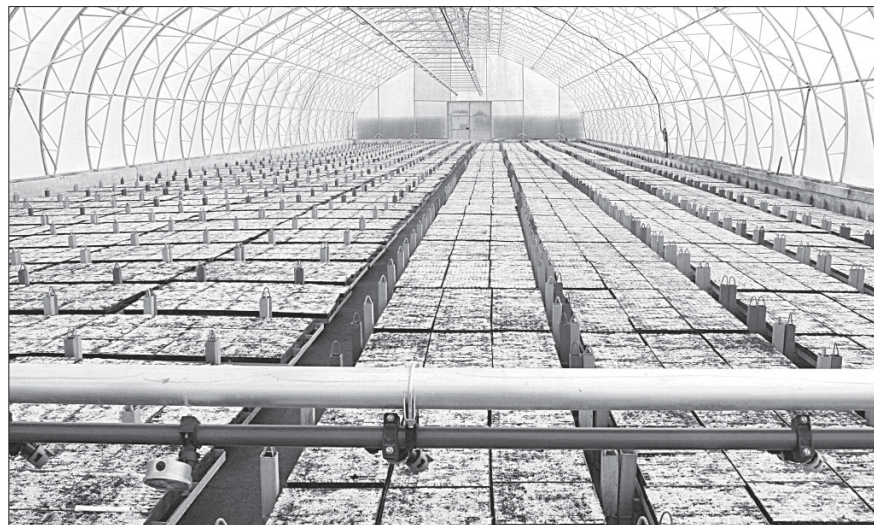
Так выращивают саженцы.