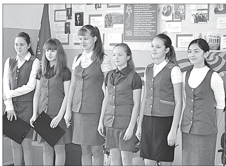
Выступают учащиеся школы.

В 1810 году в с. Межадор были открыты священнослужителями домашние школы, согласно Указу Екатерины II.