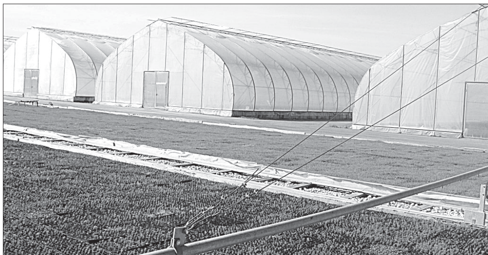
Число теплиц растёт.