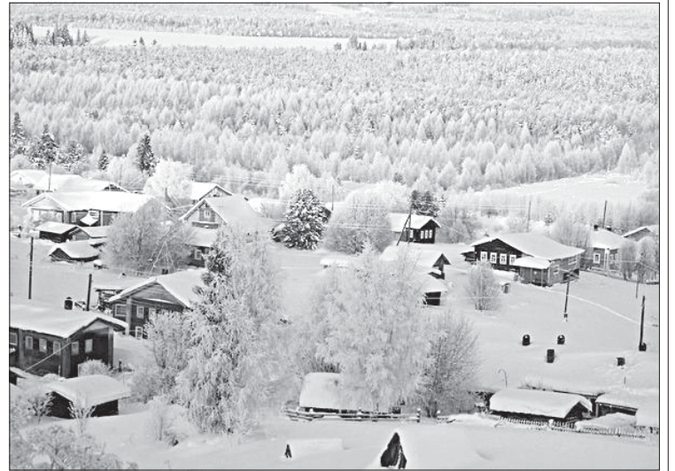
Село Чухлэм.

Включение дороги Чухлэм - Ельбаза и Заозерье - Исанево в реестр муниципального имущества будет способствовать улучшению качества её содержания. С сентября 2014 года постановлением руководителя администрации МР «Сысольский» на 5% повышена заработная плата учебно-вспомогательного и обслужи-