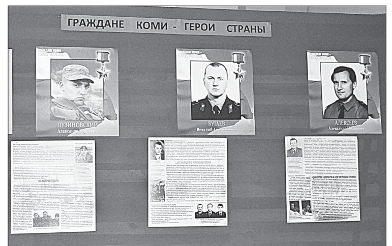
Стенд с Героями России.

Далее встреча прошла в форме дискуссии на тему «Герой и его подвиг». В итоге после долгих разговоров дети и взрослые пришли к единому мнению, что героями не рождаются, ими становятся, их формирует окружающая сре-