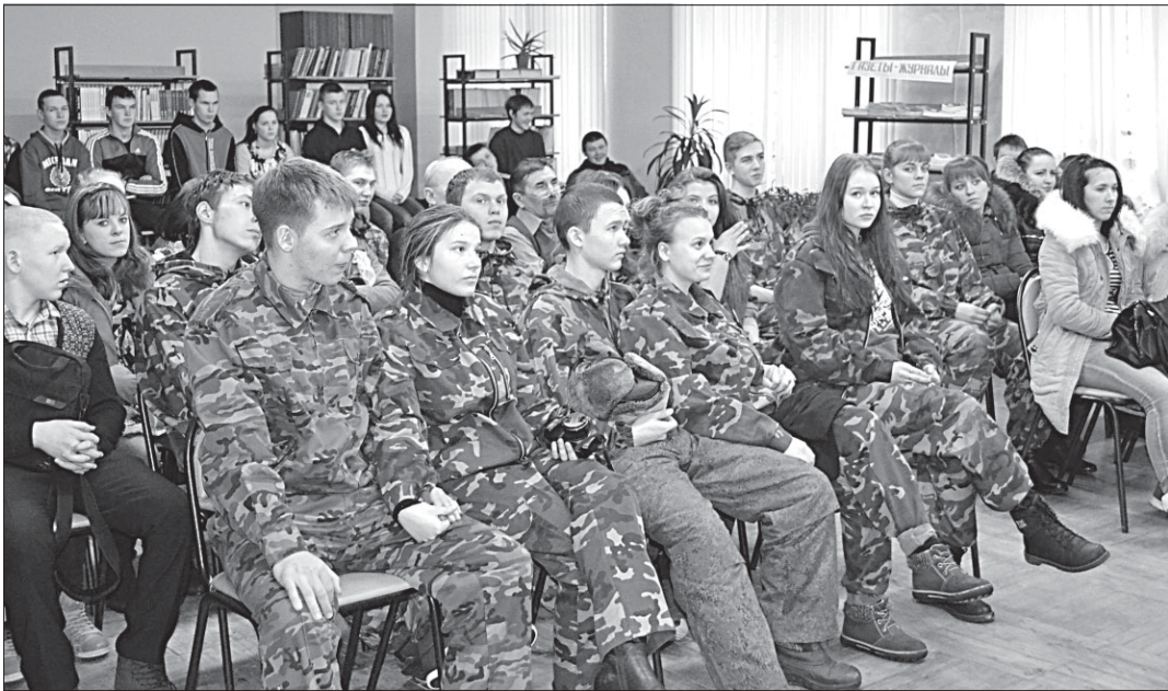
Студенты Визингского филиала КРАПТ и кадеты клуба «Патриот».