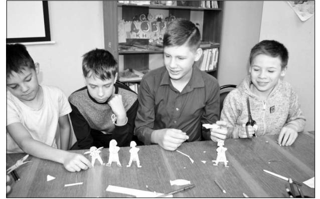
Участники встречи со своими работами.