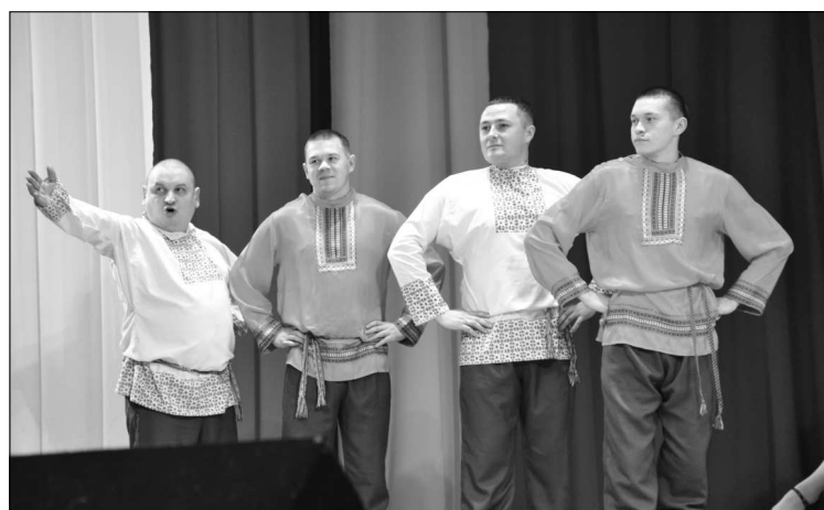
Бравые парни МО МВД России «Сысольский».

ну жены сотрудников полиции. Безусловно, их выход стал украшением праздничного вечера, особо трогательным оказался момент, когда мужья одали своих жён букетом цветов и нежным поцелуем.