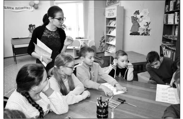
В творческом процессе.