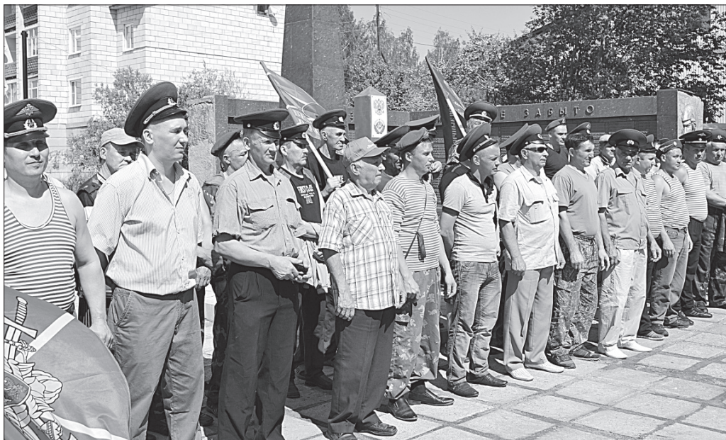
На митинге у обелиска Славы.

Стоит отметить, что для служивших на охране границ страны символическая установка пограничного столба в райцентре стала своего рода основным атрибутом праздника.