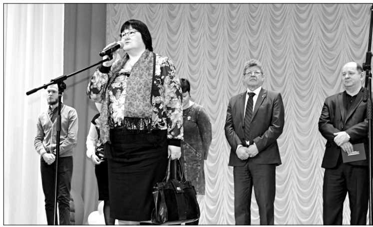
Представители учебных заведений.

Некоторые учебные заведения подготовили мастер-классы, чтобы наглядно продемонстрировать возможности, которыми обладают. Так, студенты ГПОУ «Сыктывкарский колледж сервиса и связи» провели мастер-класс «Монтаж сетевого кабеля», ГПОУ «Сыктывкарский индустриальный техникум» - «Автоматизация уличного освещения», ГПОУ «Сыктывкарский политехнический техникум» - «Сварка