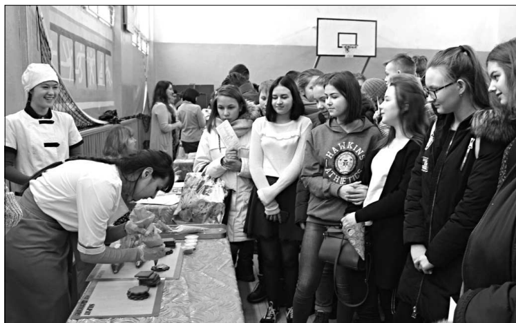
Мастер-класс от торгово-технологического техникума.

оптоволокну), ГПОУ «Сыктывкарский торгово-технологический техникум» - «Техника украшений пирожных из песочного теста». А Ухтинский государственный технический университет продемонстрировал технологии 3D-печати и 3D-моделирования, которые используются при обучении студентов.