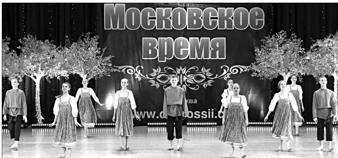
Ансамбль «Dance avenue» с композицией «Весна».