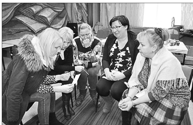
Психологи обсуждают проблемную ситуацию.

Параллельно в этот день в Визингской школе педагогами психологами регионального центра развития социальных технологий был проведен ряд