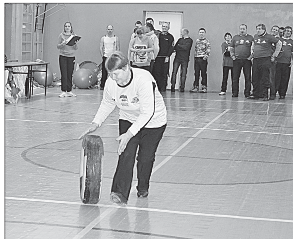
Команды участвуют в «Весёлых стартах».