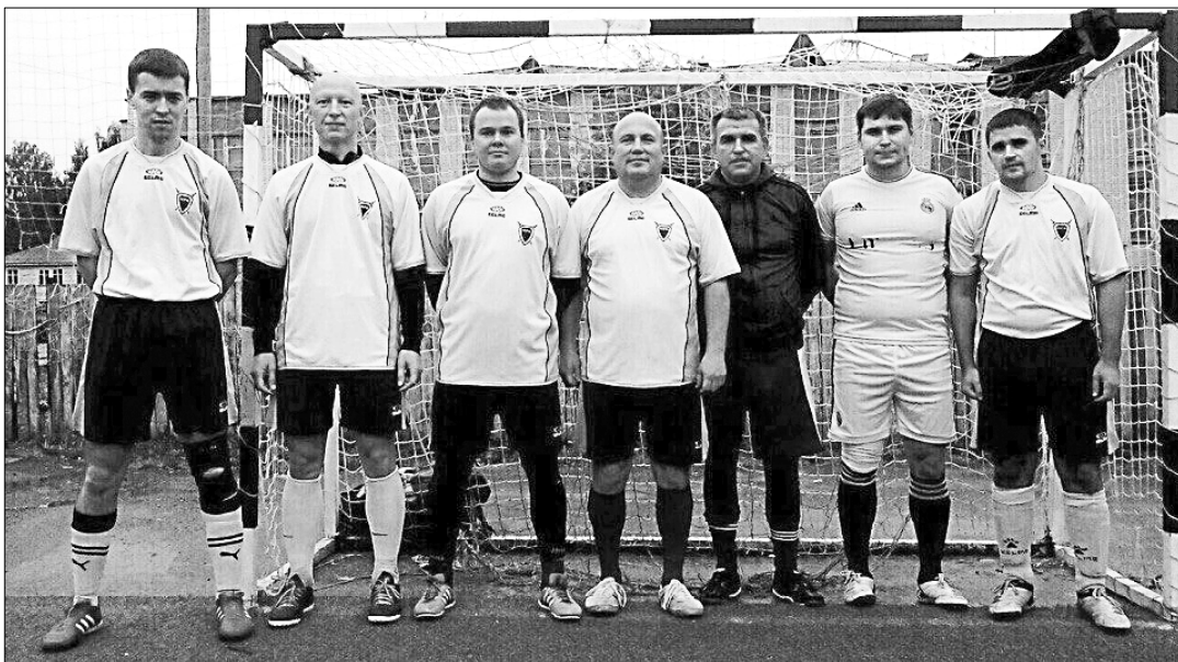
Сборная команда прокуратуры Республики Коми.