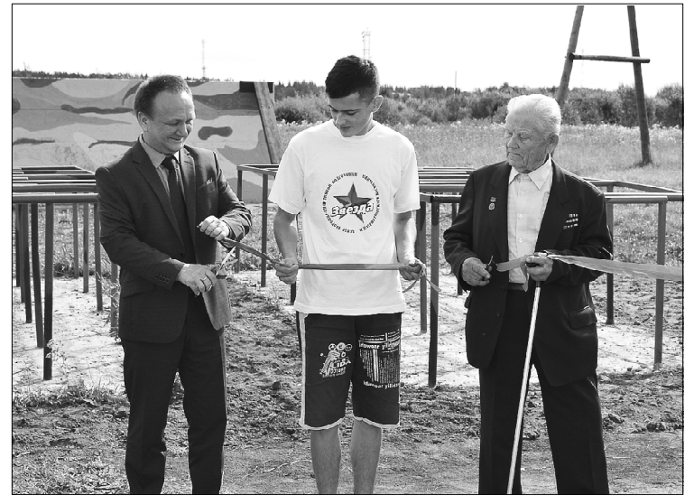
Торжественное разрезание ленточки.