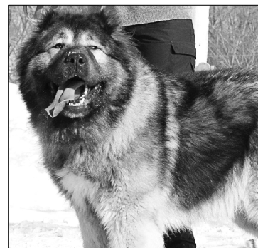
куим лун олöма аслас Альма пöдруга дорас.

Унаөн кöсийны Роккыс босьтны ас ордас, но сийö кöсий овны вöльнöя. Но горттöгыд абу кокни овнытö и поньяслы. Неважөн ветлiсны машинаөн пон кылысьяс, куталiсны горттöм поньясöс. Кызди удайтчис Роккылы спаситчыны наысь? Ми зев ёна шогсим, думайтiм, мый Роккитö кутисны. А вöлöмкö, Рокки