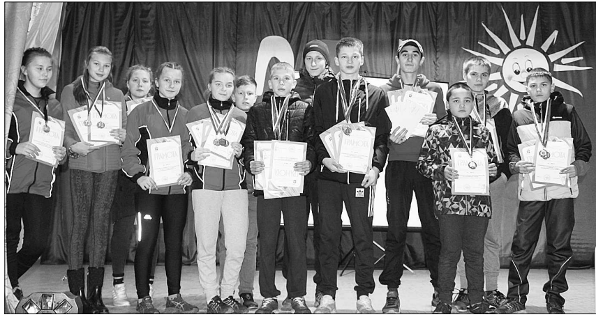
Команда Сысольского района.