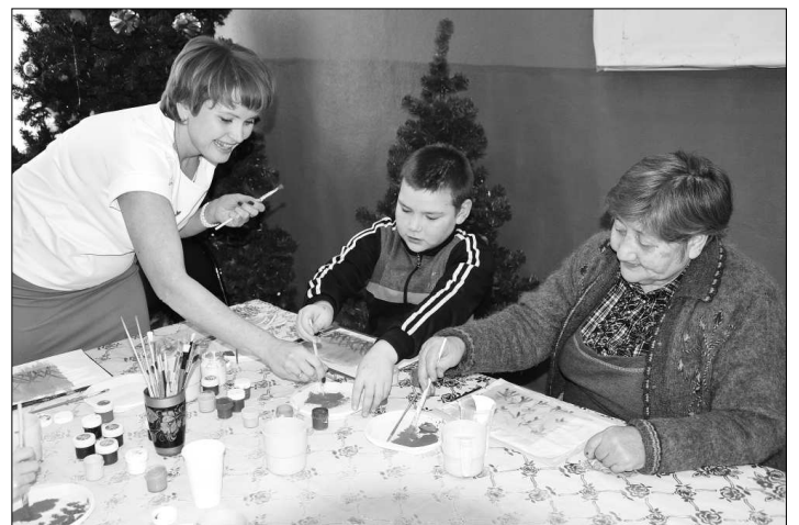
На тренинге «Правополушарное рисование».