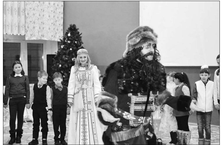
Момент сказочного представления.