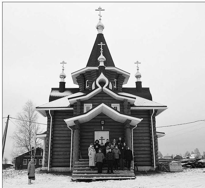
Возле церкви Христа Спасителя в Пажге.