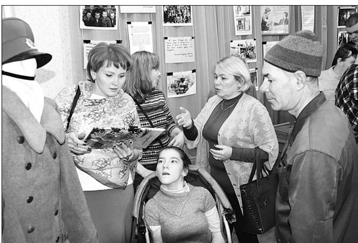
Во время квеста «Тайны музейных коллекций».