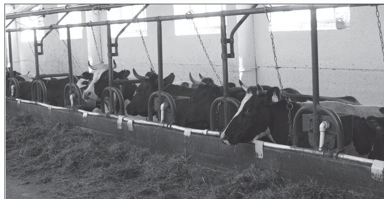
Для общественного скота готовится новое помещение.

Рядом с этим скотопомещением стоит ещё одно, как памятник не доброй памяти кризисных времён. В нём ремонт и реконструкция - дело недалёкой перспективы. Там после завершения реконструкции предполагается возложить работу по доению коров на ро-