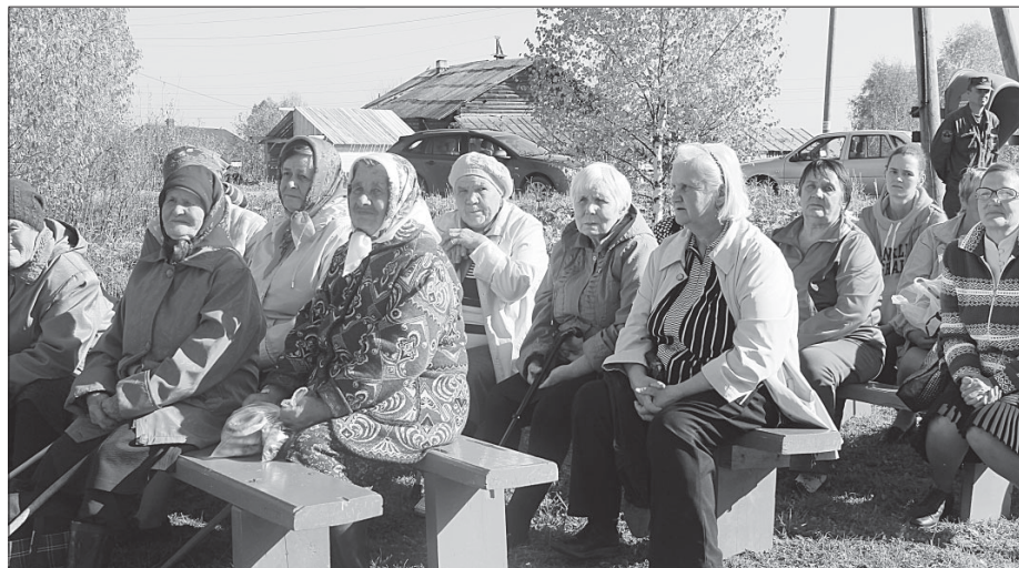
Жители д. Горьковской на празднике.