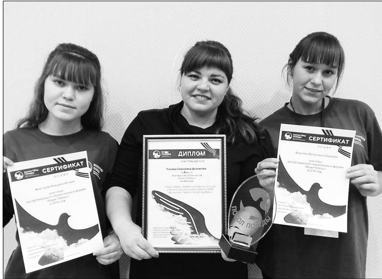
На республиканском патриотическом форуме «Внуки Победы».