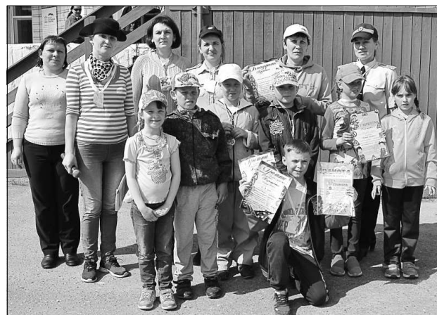
Команда-победительница с организаторами конкурса.