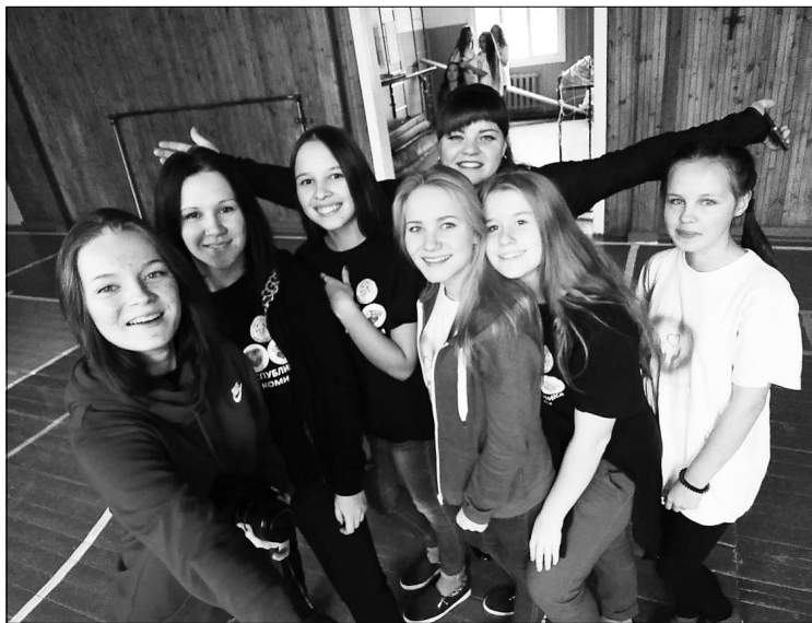
Школа активна на выезде в п. Визиндор.

ванием добровольческих отрядов. Есть в этом трудности, но есть и уверенность в положительном исходе дела.