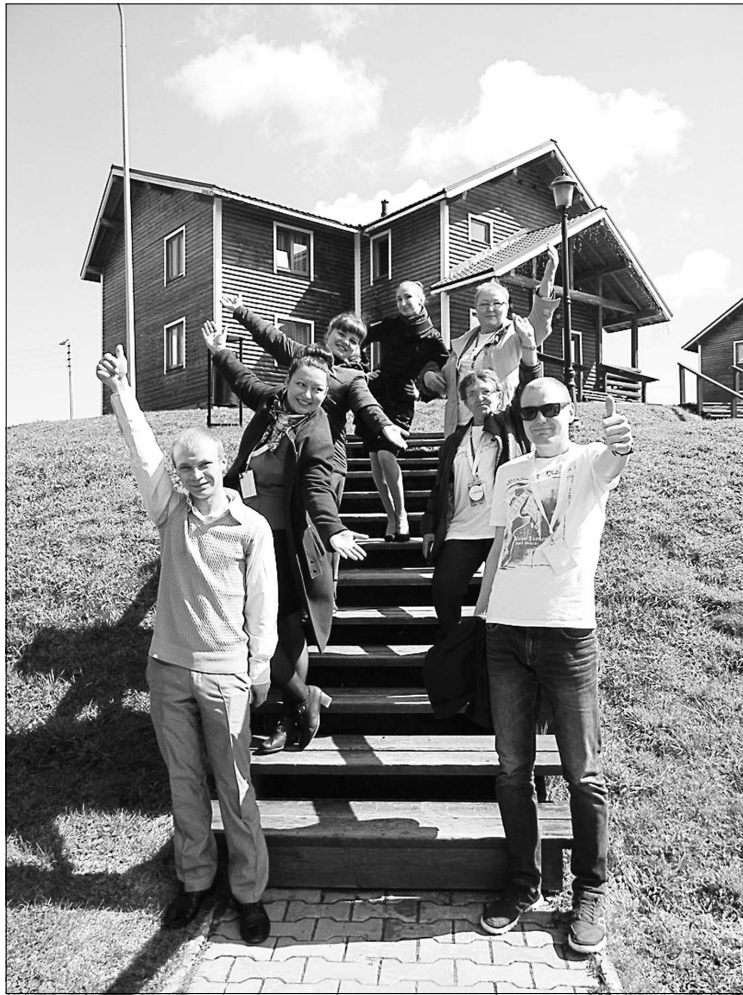
Во время республиканского форума «Доброволец».

Работы трудоёмкие, большие. Желающие их выполнить есть, но за оплату. А волонтеры трудятся не за деньги. Мы сейчас работаем над формиро-