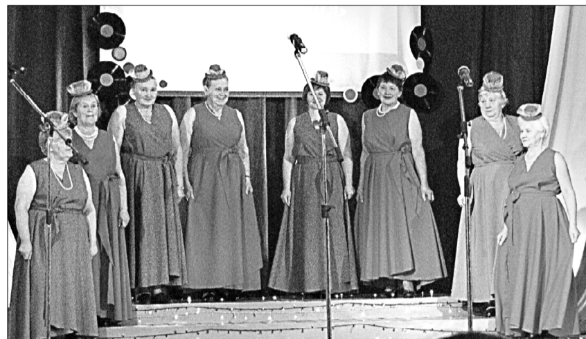
«Поёlsa аньяс» в новом образе.