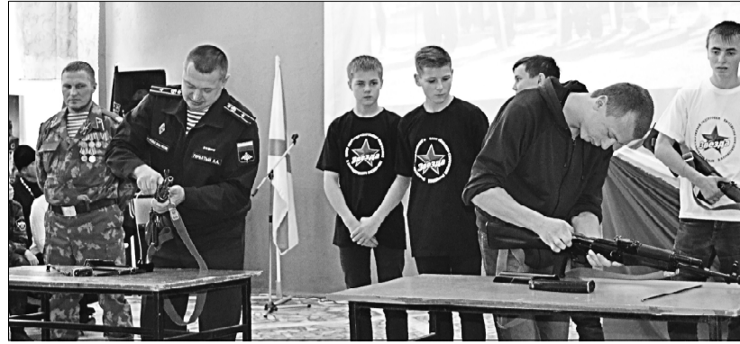
Конкурс на сборку-разборку оружия.

ЕЖЕГОДНО День призывника в нашем районе становится большим событием не только в жизни ребят, отправляющихся на службу в ряды Вооруженных сил РФ, но и для их родных, близких, односельчан. Как правило, на этом торжественном мероприятии присутствует большое количество приглашенных лиц, среди которых видные люди: депутаты Госсовета Республики Коми, руководители ведомственных структур и общественных организаций, что придает событию весьма солидный статус.