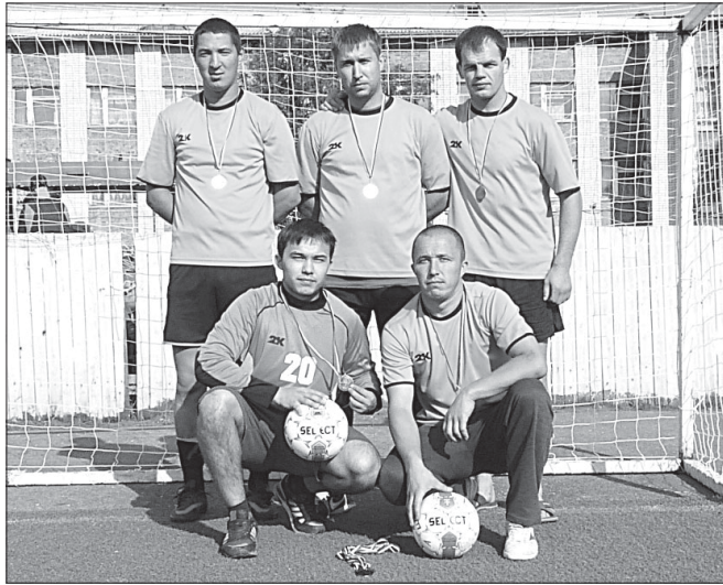
Сборная команда Сысолы.