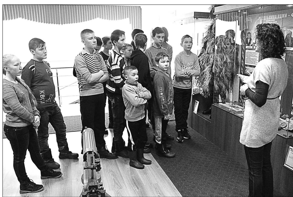
На экскурсии в музее воинской части.

Грамотно продуман и досуг солдат, желающие занимаются дополни-