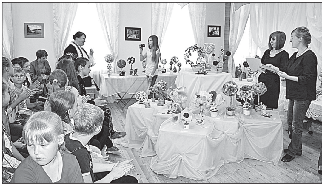
На открытии выставки.