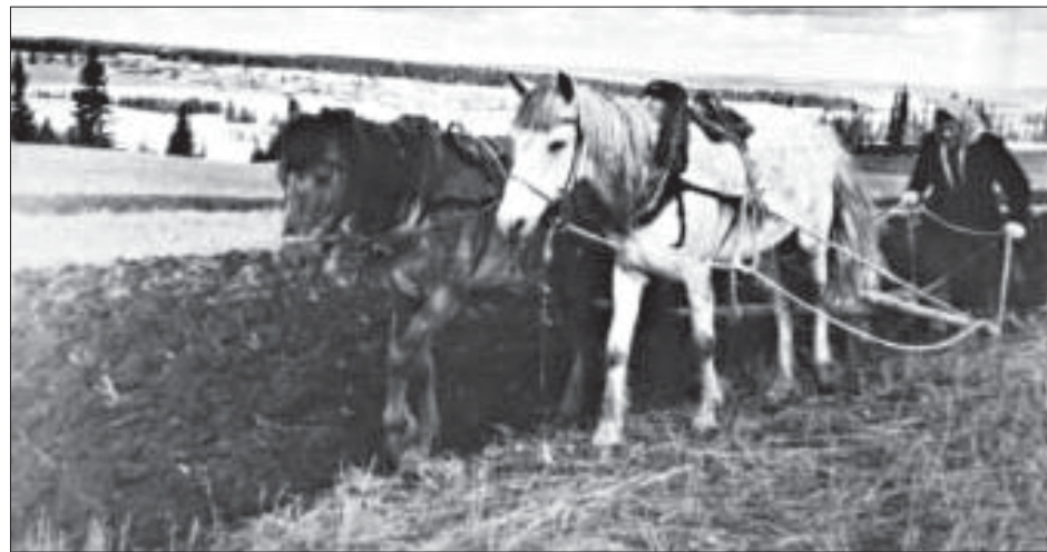
Всё для фронта, всё для Победы.

вала одежду своих родителей, старших братьев и сестёр. Вместо кальсонов носили брюки из домотканного холста, от мороза они не защищали.